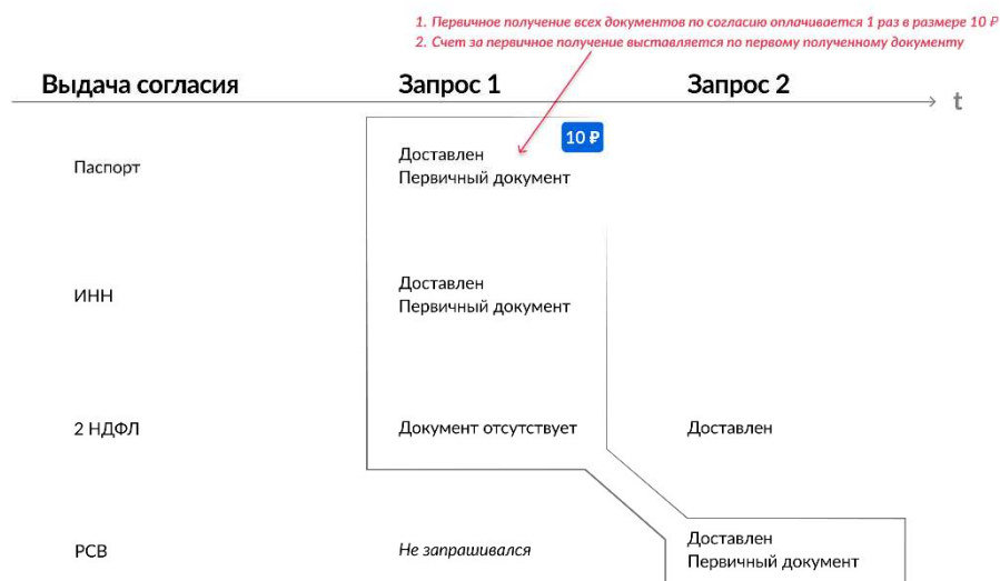
Рисунок 4 – Схема определения платности операции

Ошибочный ответ на запрос сведения приравнен к тому, что документ не запрашивался.