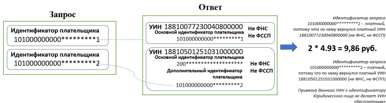
Рисунок 3 – Пример тарификации при наличии привязки информации о начисленной сумме денежных средств как к идентификатору плательщика – физического лица, так и к идентификатору плательщика – юридического лица

Операция не подлежит оплате при выполнении условий, приведенных в таблице 7.