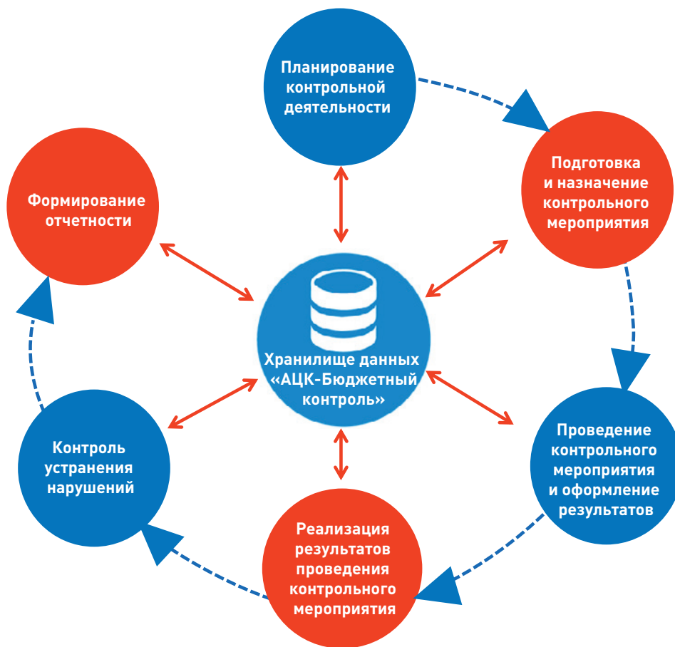
Рисунок 1. Автоматизация контрольных мероприятий города Екатеринбурга

Так, были начаты работы по автоматизации контрольно-ревизионной деятельности города на базе информационного решения «АЦК-Бюджетный контроль», полностью учитывающего все изменения законодательства. Кроме того, в рамках проведения опытной эксплуатации нам удалось полностью адаптировать систему под требования правовых актов города и обеспечить качественный и полноценный обмен информацией с ранее установленными системами исполнения, планирования бюджета и управления муниципальными закупками, а также единой информационной системой в сфере закупок (ЕИС). В настоящее время к автоматизированной системе финансового контроля подключены Департамент финансов Администрации города Екатеринбурга, Администрация города Екатеринбурга (в лице Контрольно-ревизионного управления), а также главные распорядители бюджетных средств (ГРБС).